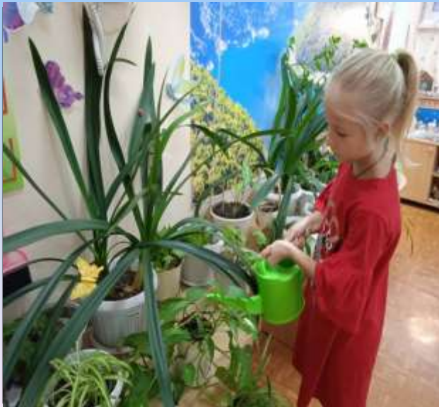
Наблюдение за комнатными растениями (полив)