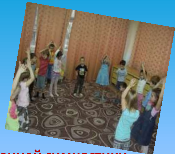
Комплекс утренней гимнастики