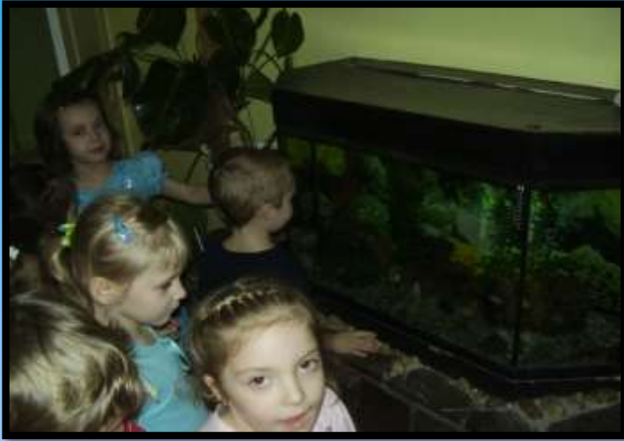
Наблюдение за рыбками в аквариуме